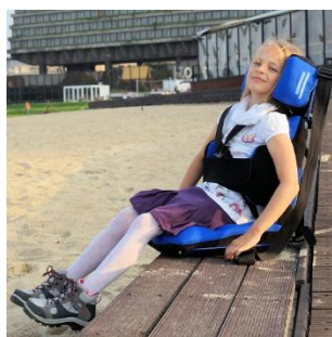
SIEDZISKO ORTOPEDYCZNE ORTHOPAEDIC SEAT