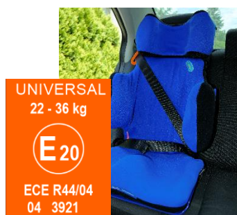
FOTELIK SAMOCHODOWY CAR SAFETY SEAT